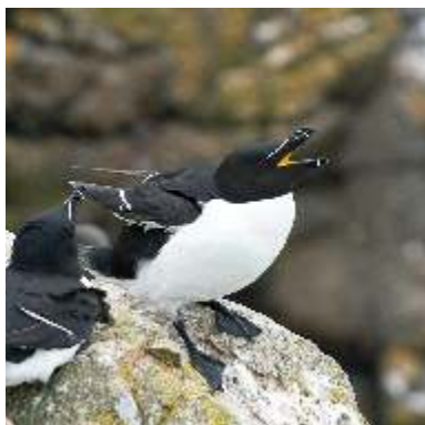
Pingouin torda ( Alca torda ) : grognements produits au nid en colonie.