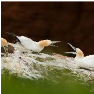
Fou de Bassan ( Morus bassanus ) : cri d'appel émis au sein de la colonie.