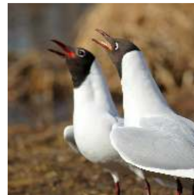
Mouette rieuse ( Chroicocephalus ridibundus ) : cri d'alerte.