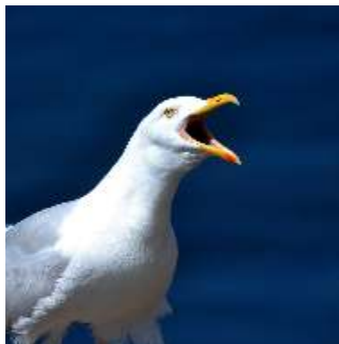
Goéland leucophée ( Larus michaellis ) : cri d'alerte.