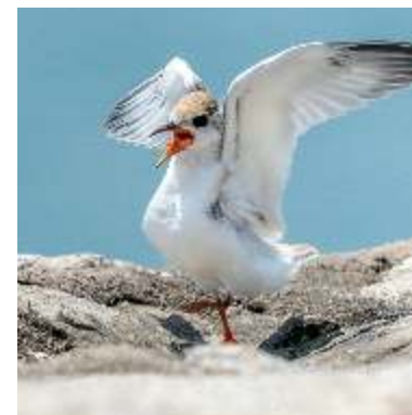
Sterne naine ( Sternula albifrons ) : cri émis pour signaler sa présence.