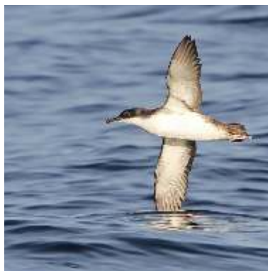
Puffin yelkouan ( Puffinus yelkouan ) : son émis pour marquer son territoire.