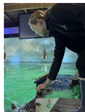
Training requin – Amélie Seaquarium Institut Marin

Pendant toute la fermeture, toutes les équipes du Seaquarium restent pleinement mobilisées.