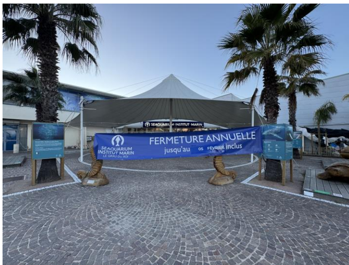
Parvis du Seaquarium – banderole de fermeture le 5 janvier 2025 - Seaquarium Institut Marin

Soigneurs et techniciens aquariologistes poursuivent leurs missions quotidiennes auprès des espèces : requins, raies, tortue, poissons, méduses, coraux, phoques, otaries et hippocampes ; en assurant soins, nourrissage, entraînements et suivi des installations.